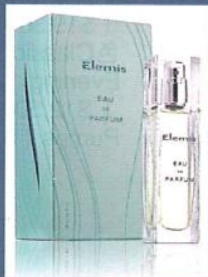
▲Elemis首支香水 eau de parfum。 ( $690 )